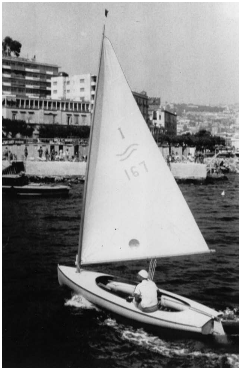
Rom 1960. Paul Elvstrøm, Danmark, guld i Finnjolle