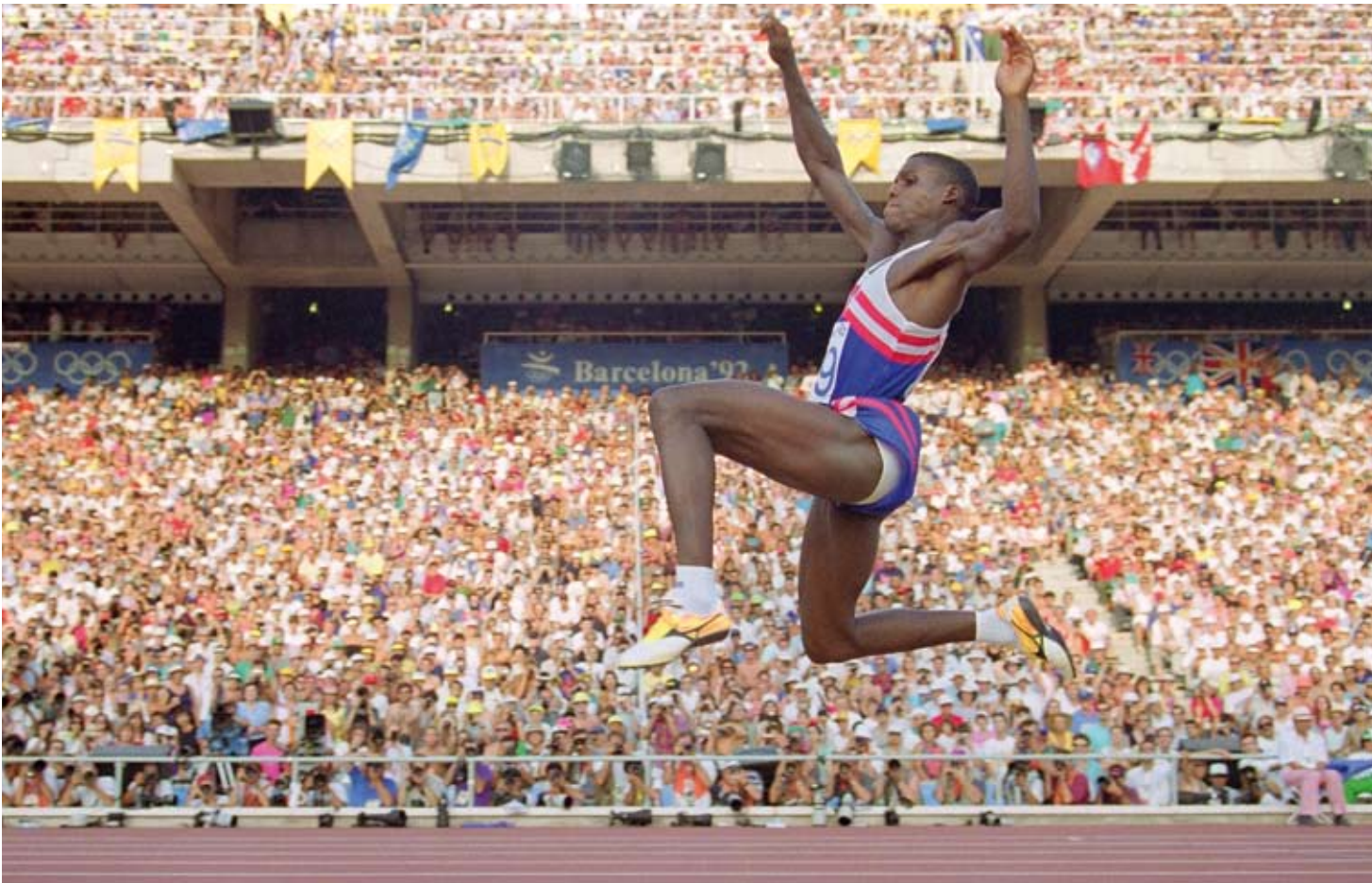
Barcelona 1992. Carl Lewis, USA, guld i længdespring