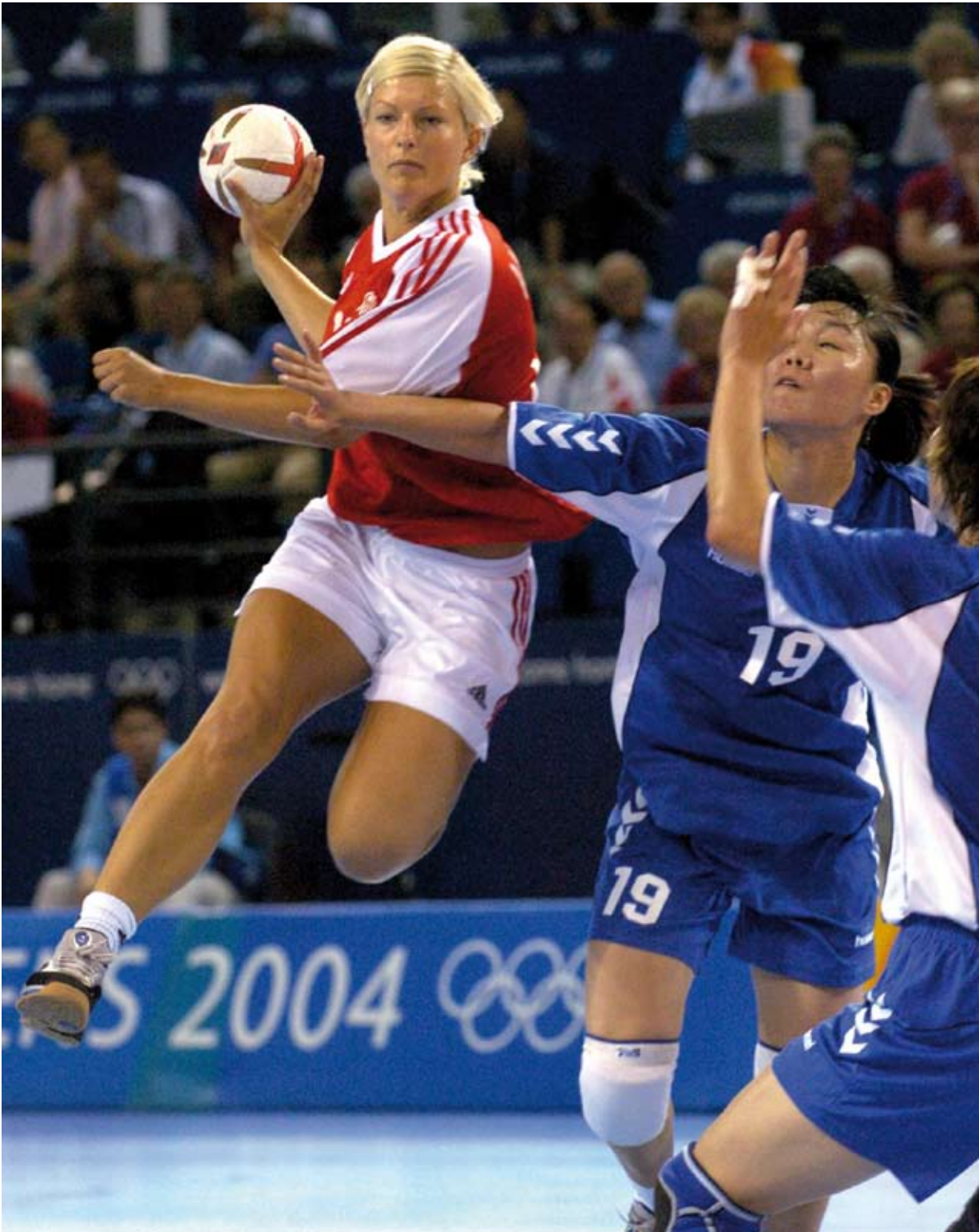
Athen 2004. Danmark, guld i damehåndbold. Foto: Kristine Andersen i finalekampen mod Sydkorea