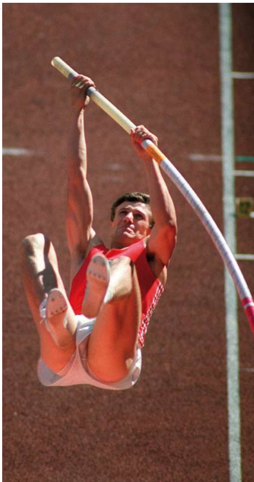
Seoul 1988. Sergei Bubka, Sovjetunionen, guld i stangspring