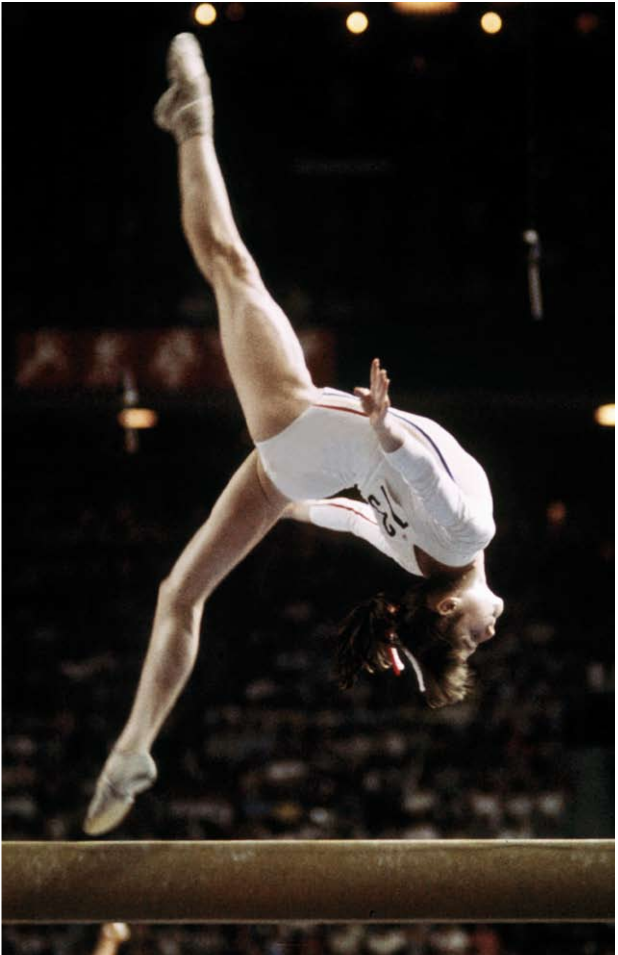
Montreal 1976. Nadia Comaneci, Rumænien, 3 guldmedaljer i gymnastik