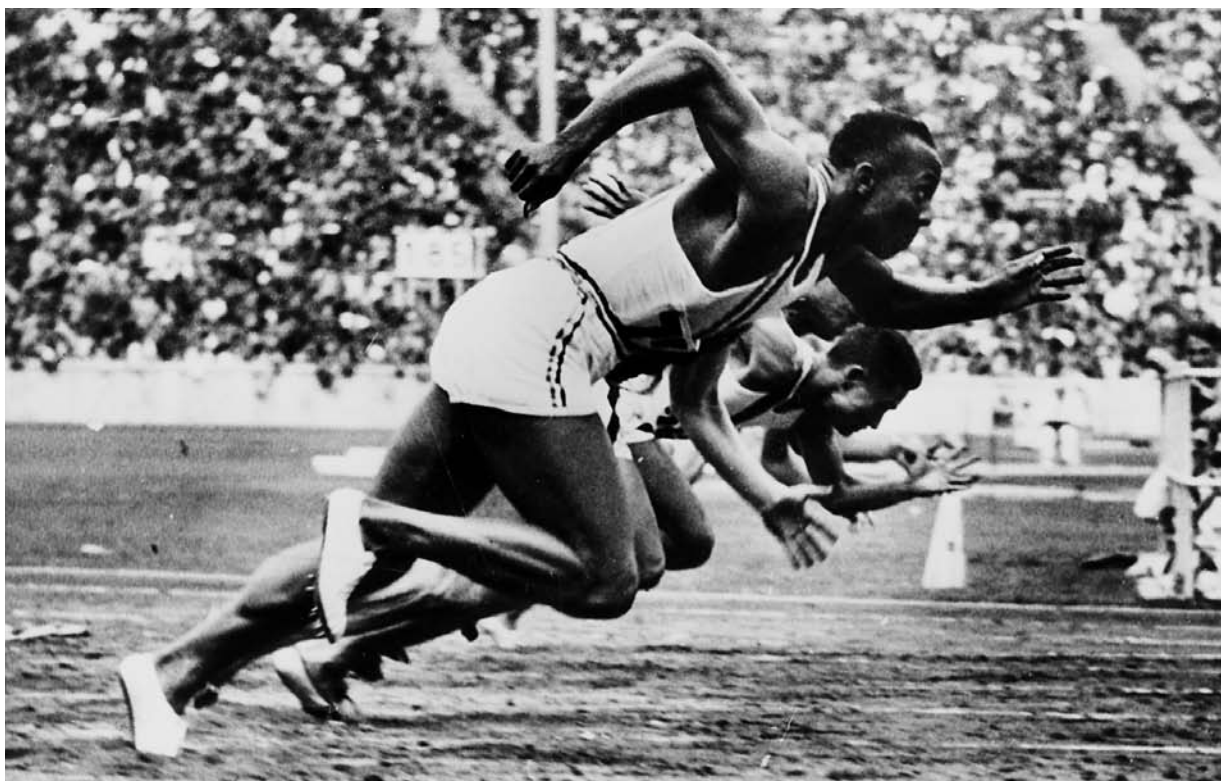
Berlin 1936. Jesse Owens, USA, guld i 100 m og 200 m løb, længdespring samt 4 x 100 m stafetløb